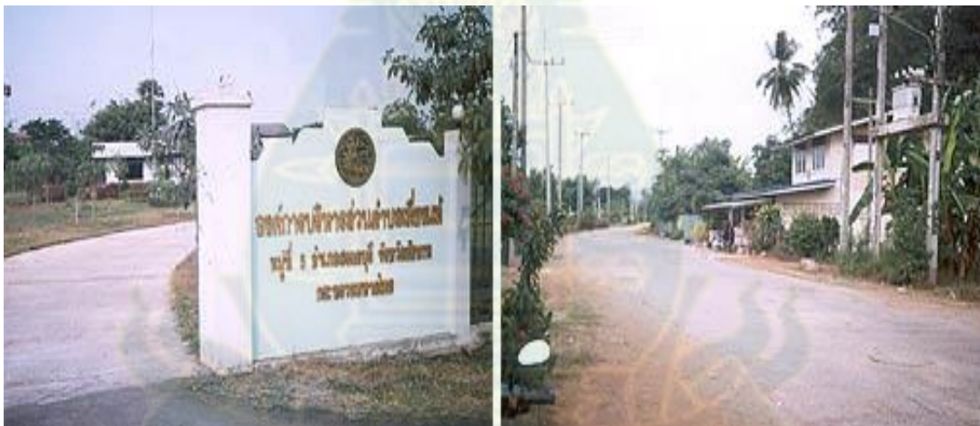
ภาพที่ 3.1 แสดงภาพพื้นที่ตำบลเที่ยงแท้ อำเภอสรรคบุรี จังหวัดชัยนาท

ตำบลเที่ยงแท้ อำเภอสรรคบุรี จังหวัดชัยนาท ประกอบด้วย 10 หมู่บ้าน ทั้ง 10 หมู่บ้าน มีครัวเรือนรวมกัน 1,509 ครัวเรือน แบ่งเป็นครัวเรือนเกษตรกร 897 ครัวเรือน มีประชากรจำนวน 6,606 คน เป็นชาย 3,239 คน เป็นหญิง 3,367 คน และมีแรงงานในตำบล 3,348 คน โดยชาวบ้านมีอาชีพหลักคือ ทำนา ทำสวน และมีอาชีพเสริม เช่น การแปรรูปผลิตภัณฑ์จากสมุนไพร และรับจ้าง