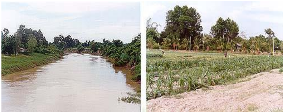
ภาพที่ 3.7 สภาพทั่วไปตำบลท่างาม อำเภอเมืองปราจีนบุรี

ส่วนสาเหตุที่ตั้งชื่อตำบลท่างามเพราะมีลำน้ำเป็นทรายขาวเรียบริมแม่น้ำบางปะกง สภาพพื้นที่ตำบลท่างามส่วนใหญ่เป็นที่ราบลุ่มเรียบริมแม่น้ำบางปะกง