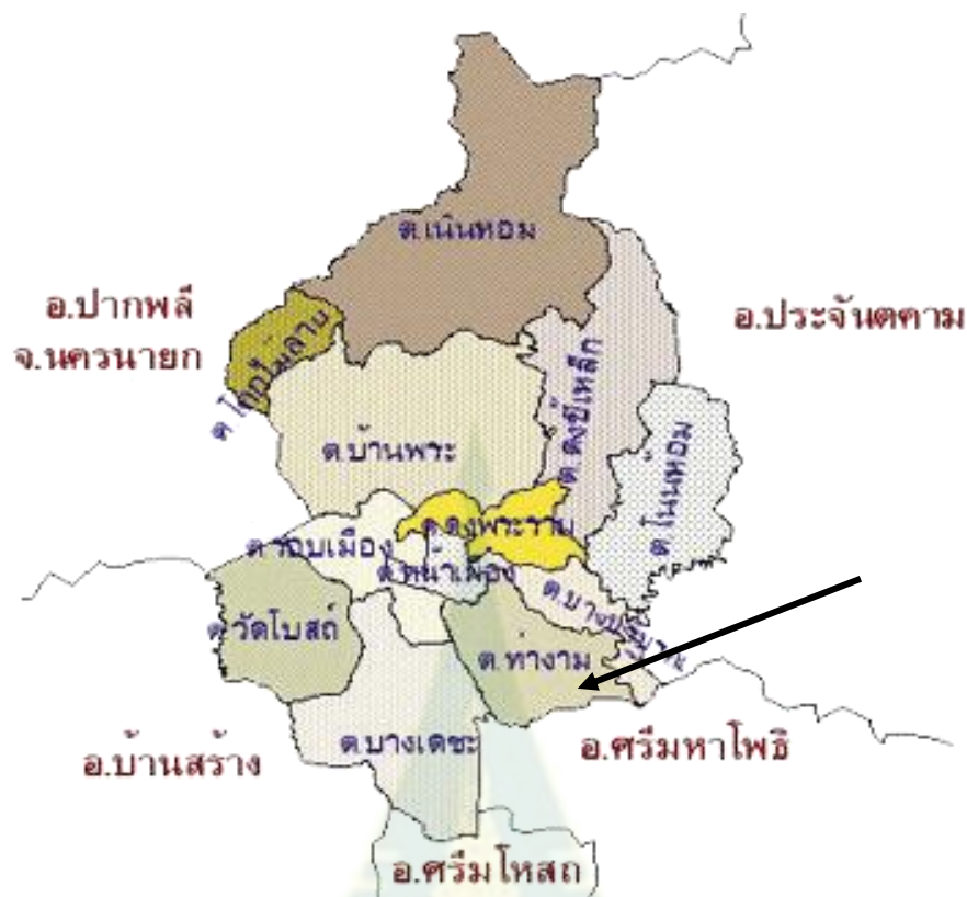
ภาพ 3.8 แผนที่ตำบลท่าข้าม อำเภอเมืองปราจีนบุรี

ตารางที่ 3.3 แสดงจำนวนประชากรในตำบลท่าข้าม