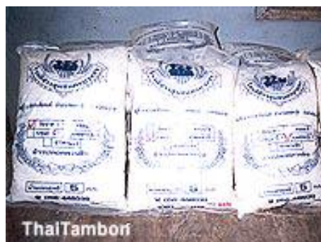
ภาพที่ 3.4 แสดงภาพข้าวปลอดสารพิษ

2) กลุ่มสมุนไพรมันทำระบาด หมู่ 3 บ้านทำระบาด ตำบลเที่ยงแท้ อำเภอสรรคบุรี จังหวัดชัยนาท ผู้นำกลุ่ม คือ คุณสำราญ เงินช้าง ผลิตภัณฑ์ที่น่าสนใจ ได้แก่ ผลิตภัณฑ์จากสมุนไพรมัน เฝือก ยามอง ซึ่งเป็นการนำสมุนไพรมันบ้านมาแปรรูปเป็นยา เพื่อบำรุงสุขภาพ และผลิตแชมพูใช้บำรุงเส้นผม โดยใช้วัตถุดิบจากสมุนไพรมันชนิดต่าง ๆ