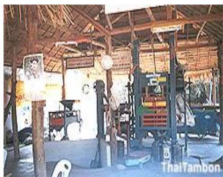
ภาพที่ 3.3 แสดงภาพโรงสีชุมชน