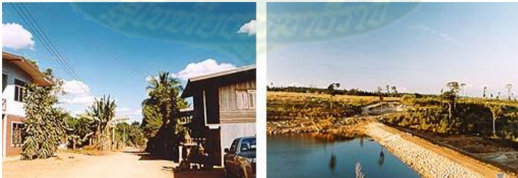
ภาพที่ 3.9 สภาพทั่วไปตำบลบ้านไร่ อำเภอเทพสถิต จังหวัดชัยภูมิ

สภาพพื้นที่โดยทั่วไปของตำบลบ้านไร่ มีลักษณะเป็นป่า เขา และที่ราบเชิงเขา ซึ่งมีพื้นที่ทั้งหมด 226.9 ตารางกิโลเมตร (141,812.5 ไร่) 10 โดยแบ่งเป็นพื้นที่ซึ่งเหมาะทำการเกษตรคิดเป็นร้อยละ 30 ของพื้นที่ทั้งหมด ส่วนที่เหลือร้อยละ 70 ไม่เหมาะกับการเกษตรเพราะมีลักษณะเป็นภูเขาซึ่งกระจายอยู่ทั่วไปทั้งตำบล โดยมีความสูงจากระดับน้ำทะเลเฉลี่ยประมาณ 350 เมตร ซึ่งมีระยะทางห่างจากที่ว่าการอำเภอ 30 กิโลเมตร และห่างจากจังหวัดชัยภูมิเฉลี่ย 70 กิโลเมตร