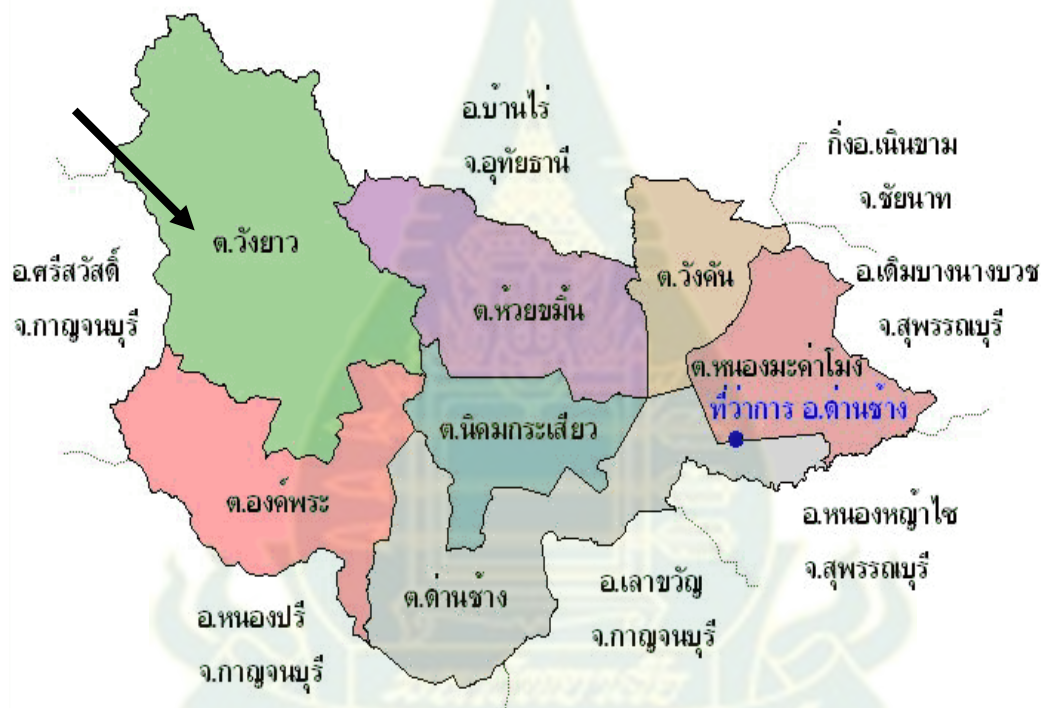
ภาพ 3.6 แผนที่ตำบลวังยาว อำเภอด่านช้าง จังหวัดสุพรรณบุรี

การประกอบอาชีพของชาวตำบลวังยาว อาชีพหลักอยู่ในภาคเกษตรกรรม เพาะปลูกข้าวโพด อ้อย ผัก รายได้เฉลี่ยประมาณ 14,322.70 บาท / ปี รายได้นอกภาคเกษตรกรรมเฉลี่ยประมาณ 19,344 บาท / ปี (รายได้รวมเฉลี่ยประมาณ 33,666 บาท / ปี) แบ่งเป็นจำนวน 29 ครัวเรือน ทำสวนผลไม้ มีพื้นที่สวนรวม 710 ไร่ พื้นที่เฉลี่ยต่อครัวเรือน 42 ไร่ มีรายได้เฉลี่ยต่อครัวเรือน 20,000 บาท / ปี โดยมีรายจ่าย ค่าปุ๋ย 500 บาท และค่าสารเคมี 320 บาท เฉลี่ยต่อครัวเรือนต่อปี จำนวน 11 ครัวเรือน ทำสวนผักรวม 53 ไร่ พื้นที่เพาะปลูกเฉลี่ยต่อครัวเรือน 8 ไร่ มีรายได้เฉลี่ยต่อ