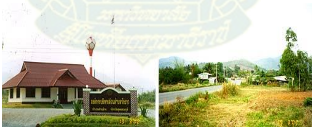
ภาพที่ 3.5 แสดงพื้นที่ตำบลวังยาว อำเภอด่านช้าง จังหวัดสุพรรณบุรี

เดิมขึ้นอยู่กับตำบลองค์พระ ต่อมาจำนวนหมู่บ้านขยายเพิ่มมากขึ้นจึงแยกมาเป็นตำบลวังยาว และแบ่งเขตการปกครองเป็น 8 หมู่บ้าน ได้แก่ หมู่ที่ 1 บ้านกล้วย หมู่ที่ 2 บ้านป่าผาก หมู่ที่ 3 บ้านวังยาว หมู่ที่ 4 บ้านชะว้างควาย หมู่ที่ 5 บ้านตะเพินคี หมู่ที่ 6 บ้านห้วยหินดำ หมู่ที่ 7 บ้านม่วงมะ และหมู่ที่ 8 บ้านใหม่วังยาว โดยประชาชนส่วนใหญ่อพยพมาจากต่างอำเภอ ต่างจังหวัด สำหรับชนพื้นเมืองดั้งเดิมเป็นชาวเขาเผ่ากะเหรี่ยง และชาวละว้าเดิม (ปัจจุบันชาวพื้นเมืองมีจำนวนไม่มากนัก เนื่องจากอพยพไปอยู่ถิ่นอื่น)