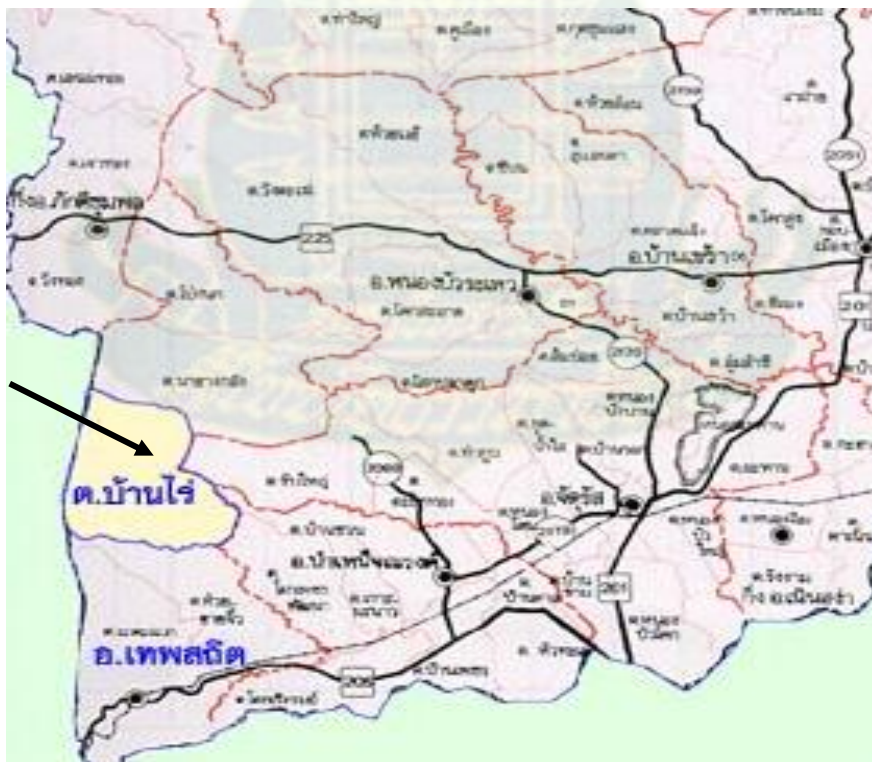
ภาพที่ 3.10 แผนที่ตำบลบ้านไร่ อำเภอเทพสถิต จังหวัดชัยภูมิ

สำหรับเส้นทางการคมนาคมในการเดินทางเข้าสู่ตำบล จากกรุงเทพฯ สามารถใช้เส้นทางหลวงหมายเลข 1 (ถนนพหลโยธิน) ผ่านรังสิตวังน้อย จนถึงสามแยกจังหวัดสระบุรี เลี้ยวขวาไปตามเส้นทางหลวงหมายเลข 2 (ถนนมิตรภาพ) แล้วแยกซ้ายเข้าสู่ทางหลวงหมายเลข 201 ที่อำเภอสีคิ้ว อำเภอด่านขุนทด เข้าสู่จังหวัดชัยภูมิ แล้วเลี้ยวที่ทางแยกบ้านหนองบัวโคก เข้าสู่เส้นทางสายหนองบัวโคก-ชัยบาดาล (ทางหลวงหมายเลข 205) ถึงอำเภอเทพสถิต เลี้ยวขวาเข้า ตำบลบ้านไร่